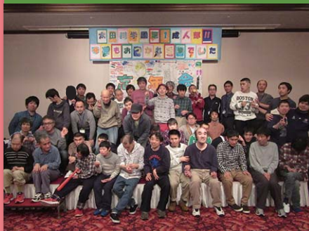
平成28年12月14日 忘年会 広島サンプラザ