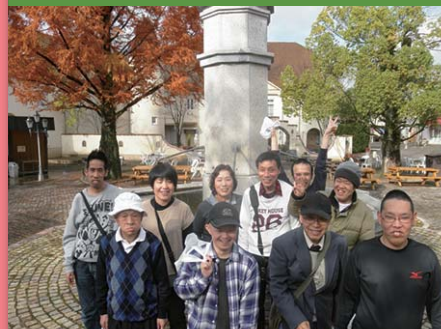
平成28年11月19・20日 一泊旅行 岡山県赤磐市・倉敷市