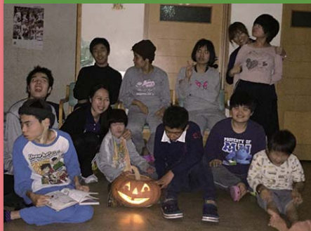
平成28年10月31日 ハロウィンパーティー