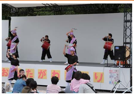
琉球創作 エイサー龍和