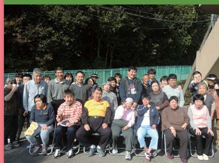
平成28年11月4日 バーベキュー