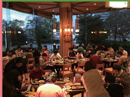
平成28年12月22日 忘年会 広島市文化交流会館