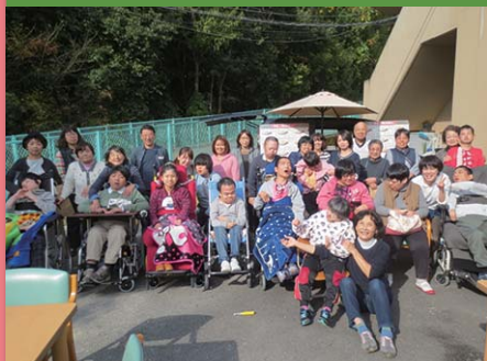
平成28年11月15日 会食ランチ