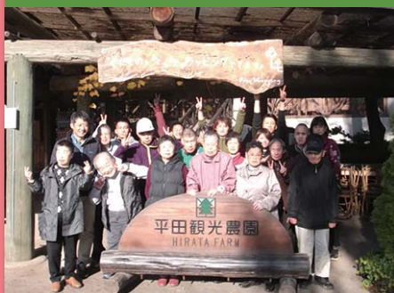
平成28年11月16日 一泊旅行 平田観光農園