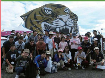
平成28年9月13日 木下大サーカス