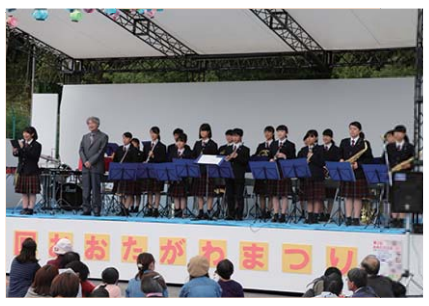
広陵高等学校吹奏楽部