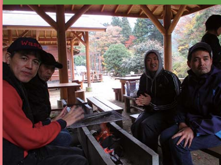
平成28年11月18日 アウトドア・バーベキュー 七瀬川溪流釣り場