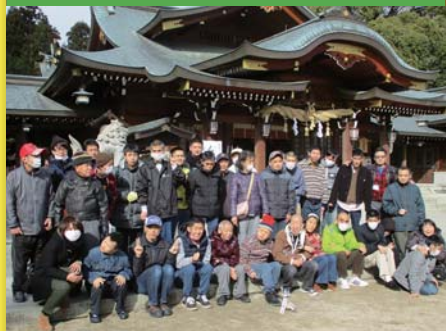
平成29年1月13日 新年会 速谷神社