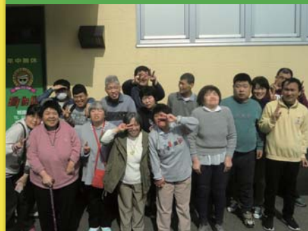
平成29年3月3日 活動打上げ会 カラオケ ビリー・ザ・キッド祇園店