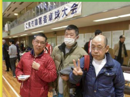
平成29年2月5日 第20回広島市障害者卓球大会