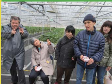
平成29年3月15日 嗜好別行事「いちご狩り」 きんた農園ペリーネ