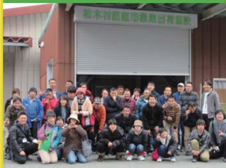
平成29年3月14日 活動打上げ会 島根県吉賀町(旧柿木村)産直市場集出荷施設