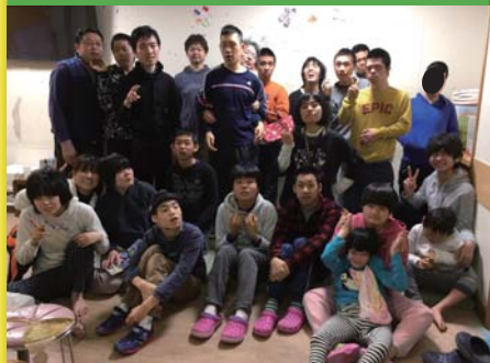
平成29年3月31日 お別れ会