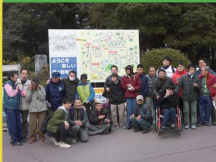
平成29年2月13日 男子寮行事 徳山動物園