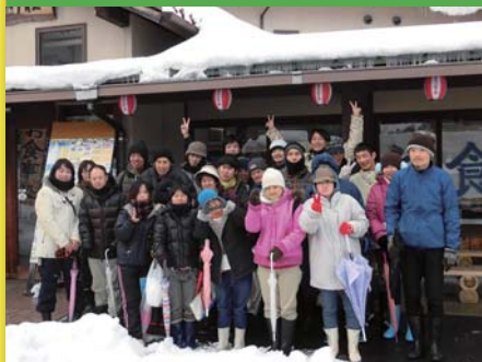
平成29年1月15日 新年会 豊平どんぐり村どんぐり荘