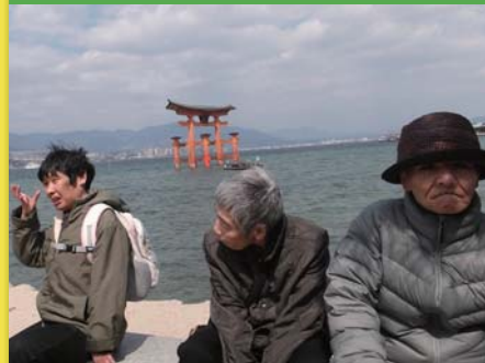
平成29年3月14日 嗜好別行事 宮島