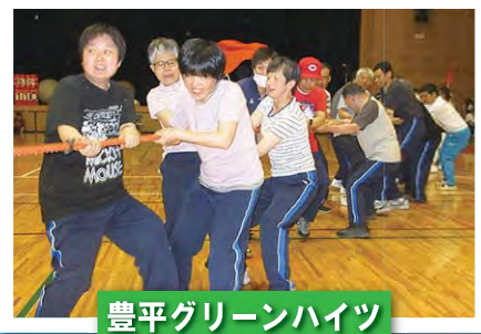
豊平グリーンハイツ