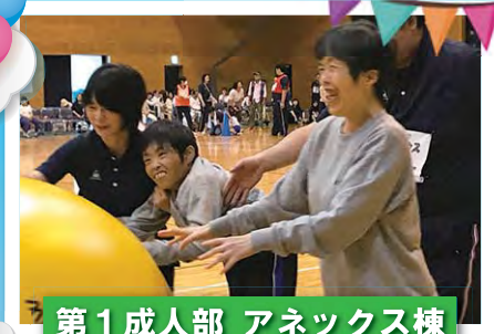
第1成人部 アネックス棟