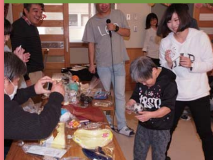
平成30年12月19日 忘年会 高陽寮