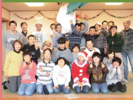
平成30年12月23日 忘年会 豊平ケアホーム