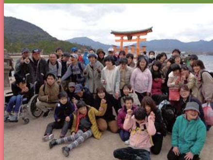
平成30年12月18日 忘年会 宮島 錦水館