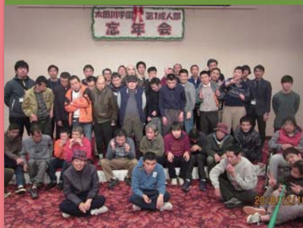
平成30年12月10日 忘年会 広島サンプラザ