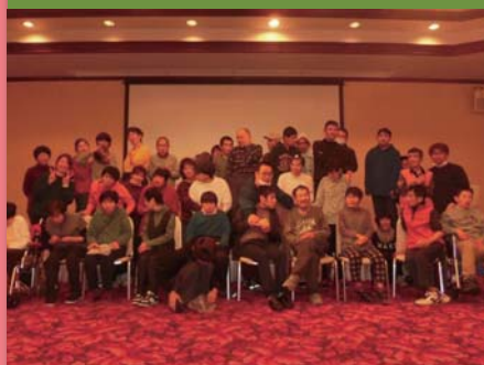
平成31年1月15日 新年会 広島サンプラザ