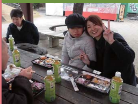
平成30年12月11日 ハイキング 備北丘陵公園