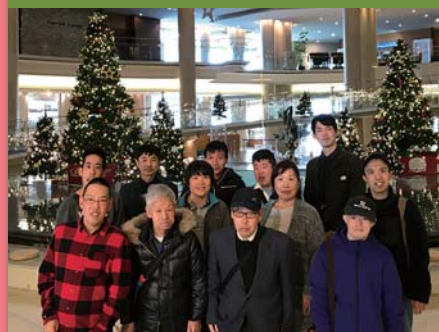
平成30年12月15日 忘年会 グランドプリンスホテル広島