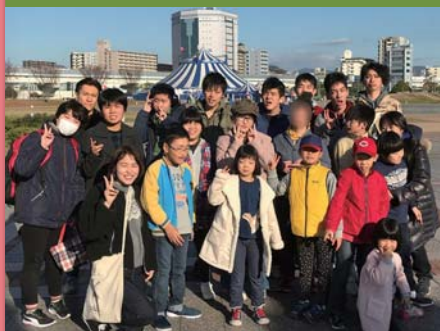
平成30年12月25日 クリスマス会 広島みなと公園 ハッピードリームサーカス