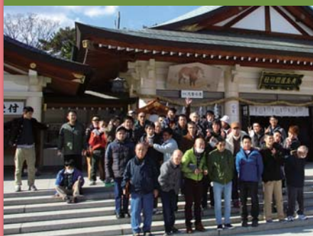
平成31年1月21日 初詣 広島護国神社