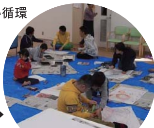
平成31年 児童部アート活動の様子 →