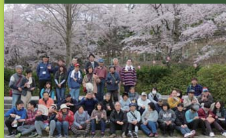
平成31年4月12日 遠足 土師ダム