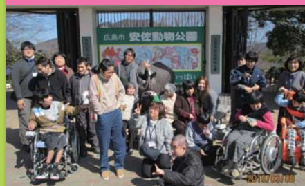
平成31年3月8日 活動打上げ 広島市安佐動物公園