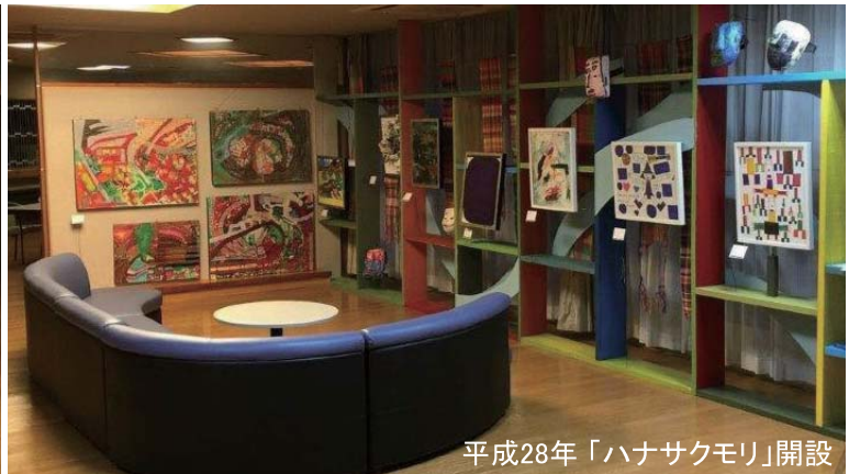
平成28年「ハナサクモリ」開設

ギャラリー運営委員会が発足してから4年目を迎えました。こうして長く活動してこれたのも、作家である利用者みんなが、活動の度に魅力的な作品を生み出してきたからです。これからも今までと変わらず、かつ中身を濃くしていきたいと思っています。応援よろしくお祈いします！