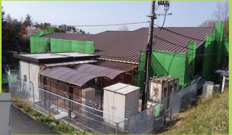
↑ 大規模修繕工事が始まった第3成人部の様子 ← 仮設住居の様子

第3成人部作業室を仮設住居とし、各部、順次に工事をしていき、来年の9月上旬に、工事が終了する予定です。工事に伴い、関係車両の出入りが激しくなるため、学園にお越しの際は、十分にお気を付けください。