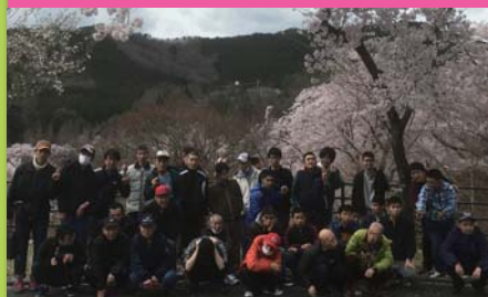
平成31年4月11日 花見 土師ダム