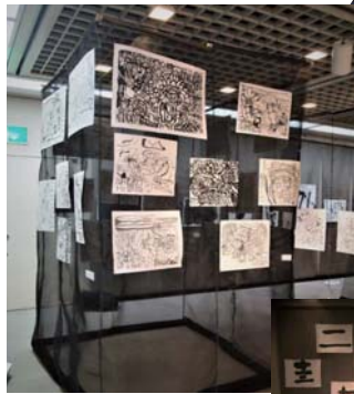
↑ 平成30年「心書倶楽部展」