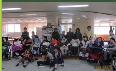
平成31年3月13日 活動打上げ デイルーム