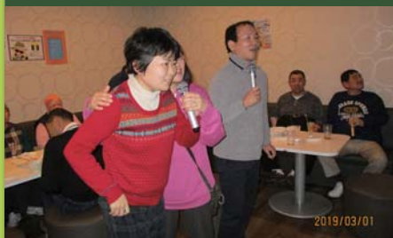
平成31年3月1日 活動打上げ カラオケビリーザ・キッド祇園店