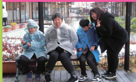
平成31年3月6日 女性棟行事 広島マリーナホップ