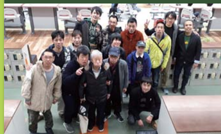
平成31年3月9日 慰労会 ミスズガーデン