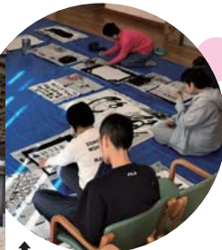
↑ 平成31年「書は楽しい」の様子

平成28年7月にギャラリー「ハナサクモリ」が開設され、当委員会がその管理・運営を担ってきました。