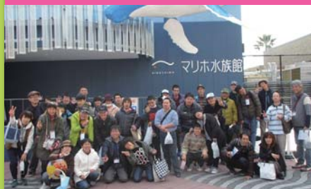
平成31年3月7日 作業打上げ マリホ水族館