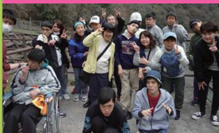
平成31年4月3日 花見 温井ダム