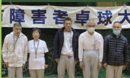
平成31年2月3日 第22回広島市障害者卓球大会 広島市心身障害者福祉センター