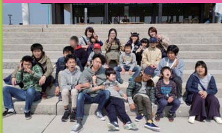
平成31年3月25日 お別れ会 広島マリーナホップ