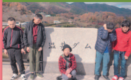
令和元年11月26日 嗜好別行事「ピクニック」 温井ダム、道の駅来夢とごうち