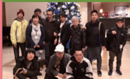
令和元年12月7日 忘年会 ANA クラウンプラザホテル広島