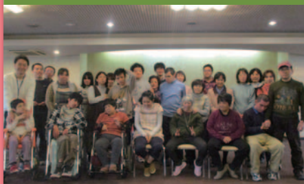
令和元年11月20日 秋の行楽「会食」 酔心毘沙門店