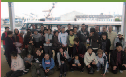
令和元年11月7日 日帰り旅行2班 瀬戸大橋クルージング