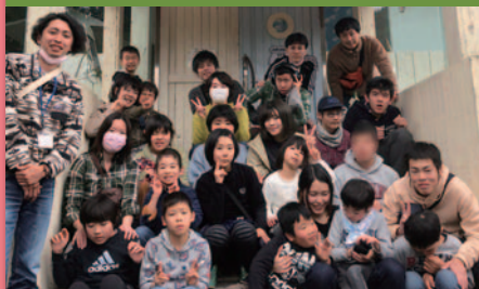
令和元年12月26日 クリスマス会 三次もののけミュージアム