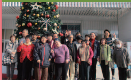
令和元年11月26日 秋の行楽「会食」 イオンモール広島祇園