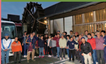
令和元年11月27日 ひろしまドリームセッション2019見学と会食 田舎茶屋わたや八木店