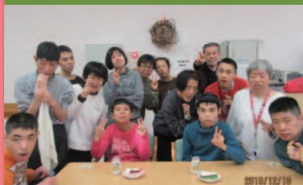
令和元年12月18日 12月誕生者会 食堂