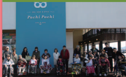
令和元年11月15日 秋の行楽「会食」 広島マリーナホップ