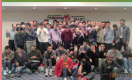
令和元年12月19日 忘年会 広島サンプラザ