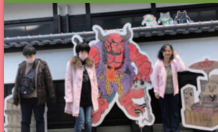
令和元年11月19日 グルメ行事 広島三次ワイナリー、三次もののけミュージアム