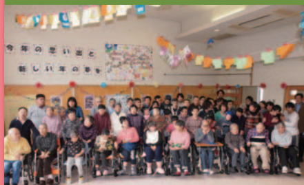
令和元年12月18日 忘年会 高陽寮食堂