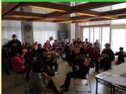
令和2年3月5日 活動打上げ会