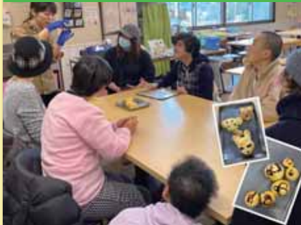
令和2年2月20日 7,9寮グルメ行事 八天堂カフェリエ