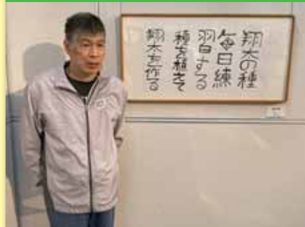
令和2年2月8日 広島市ピースアートプログラム アート・ルネッサンス 2020 合人社ウエンディひと・まちプラザ