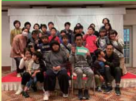
令和2年3月26日 卒業生を祝う会 広島サンプラザ