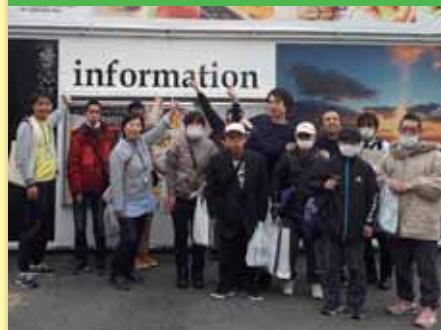
令和2年3月5日 慰労会 三次グランドホテル