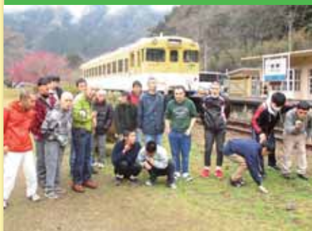
令和2年3月4日 ドライブ 温井ダム