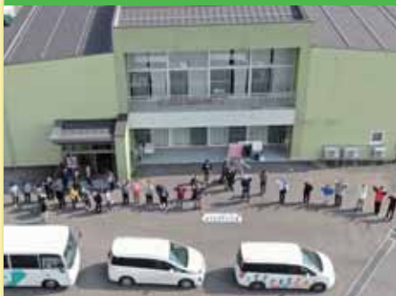
令和2年3月18日 お楽しみ会