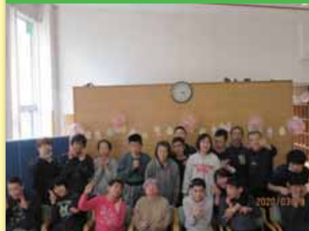
令和2年3月19日 年度末利用者打上げパーティー 食堂