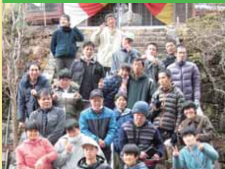
令和2年1月19日 新年会 福王寺, 可部ボウル