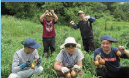
令和4年6月22日 「畑の玉ねぎ収穫」豊平作業所