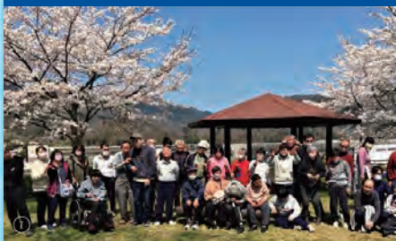
令和4年4月6日 「遠足」温井ダム