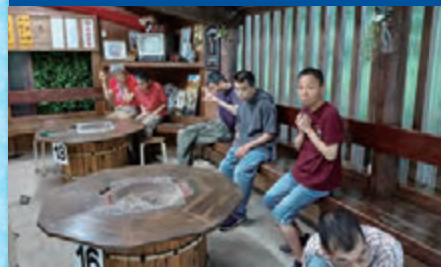
令和4年6月21日 「8寮グルメ行事」溪流茶園