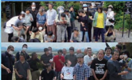
上段: 令和4年5月17日 女性棟行事「ピクニック」平田観光農園 下段: 令和4年5月19日 男性棟行事「ピクニック」広島県立中央森林公園