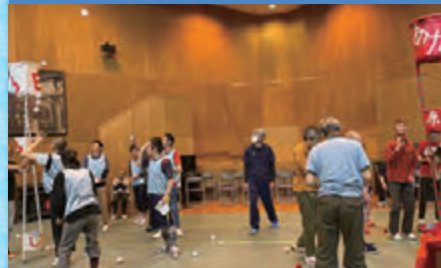
令和4年5月30日 「運動会」地域交流センター