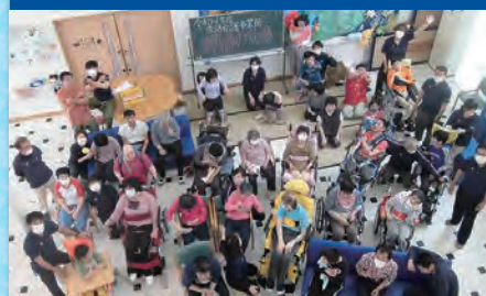
令和4年5月26日 「顔合わせ会」トラバユ棟