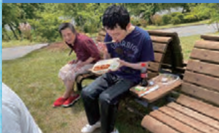
令和4年5月23日 「ピクニック」県立もみのき森林公園