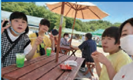
令和4年6月28日 「ピクニック」せら夢公園