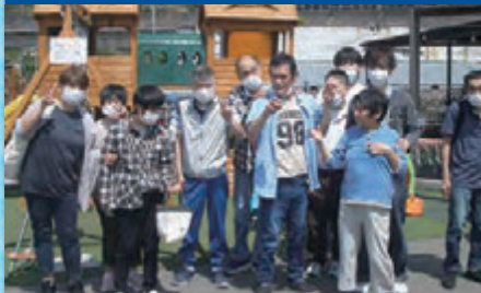
令和3年5月17日 嗜好別行事「バーベキュー」大塚西 BBQ テラス