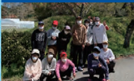
令和4年4月17日 「余暇ドライブ」竜頭山登山口