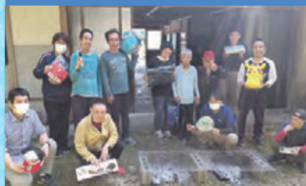
令和4年5月14日 「バーベキュー」沼田ケアホーム園庭