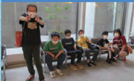
令和4年6月17日 「新県美展見学」広島県立美術館