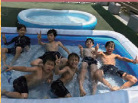
令和4年8月14日 プール遊び 児童部テラス