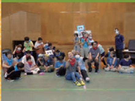
令和4年6月20日 第2成人部 運動会 地域交流センター