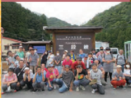
令和4年8月25日 行楽行事「三段峡」 三段峡