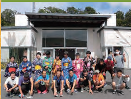
令和4年9月16日 納涼祭 豊平ケアホーム内