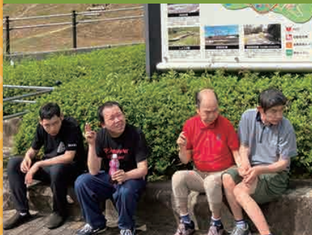
令和4年9月17日 グループ別行事 広島三次ワイナリー