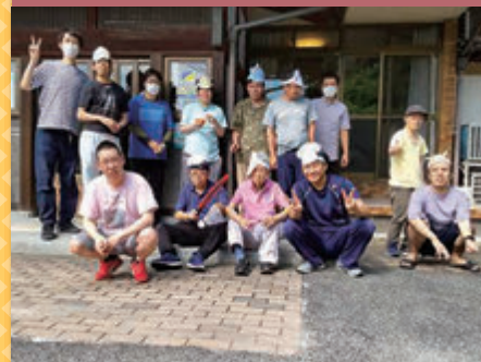
令和4年8月27日 納涼祭 沼田ケアホーム内