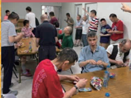
令和4年8月23日 納涼会 第3成人棟内