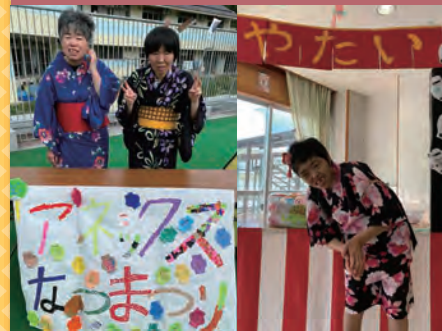
令和4年9月28日 アネックス夏まつり アネックス棟内