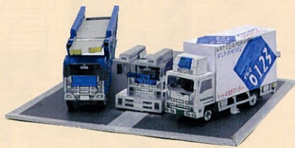
「3台のトラック」 松海 英知