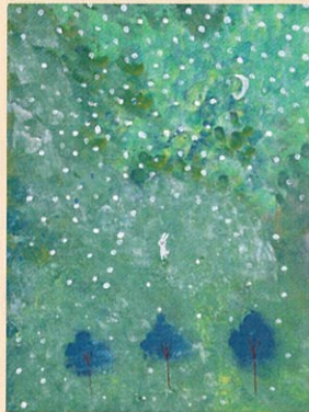
「雪 こんこん」 新 三千代