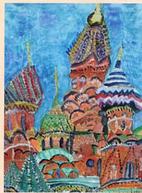
「ヴァシーリー聖堂(ロシア)」 森田 慧