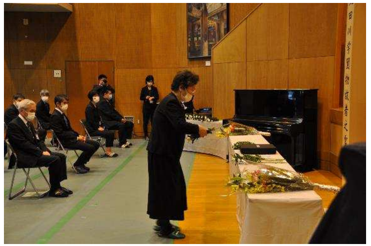
献花（各保護者会役員）